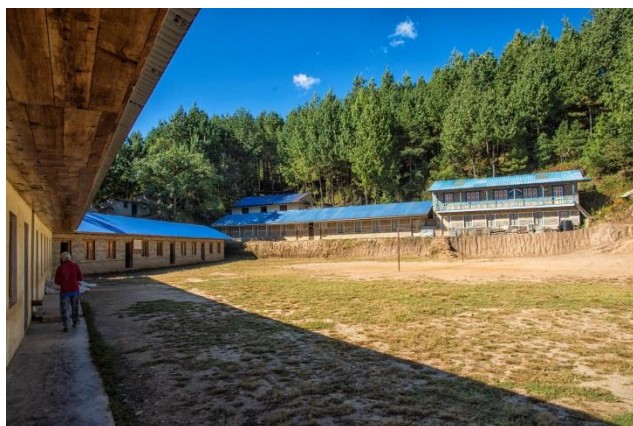
Ecole secondaire de Basakhali (novembre 2017)

Le village a connu d'autres évolutions importantes dans le domaine de l'éducation et de la santé avec l'apport de notre association qui a participé à la construction d'écoles et à la mise en place d'un dispensaire .