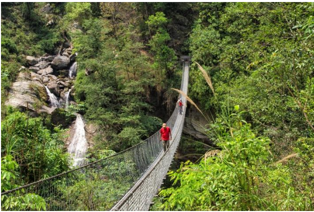
Le pont métallique construit en 2009