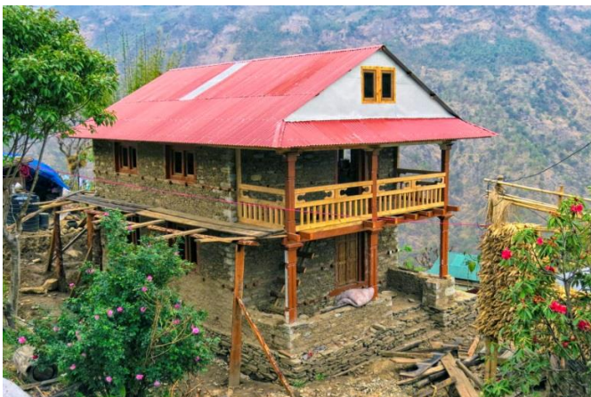
Première maison parasismique reconstruite (printemps 2017)

En mars 2018, en sus de la maison test, cinq autres maisons parasismiques sont reconstruites à Rapcha.