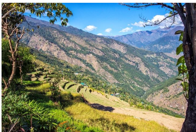
Cultures en terrasses près de Rapcha au-dessus de la Dudh Khosi

Depuis seulement la fin 2017, le village est accessible par une piste en jeep. Jusqu'à présent, le petit aéroport de Phaplu était à 2 jours de marche et le dernier point d'accès par la route à 7 jours.