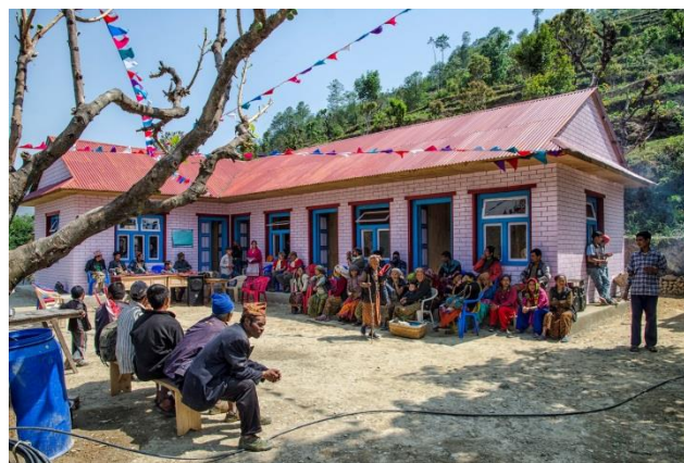
Inauguration du dispensaire (mai 2013)

En outre, l'association a réussi à faire construire un pont métallique au-dessus de la rivière pour désenclaver le village. A ces réalisations concrètes s'ajoutent un volet culturel, des publications sur les traditions de l'ethnie Khaling Rai et l'organisation de treks solidaires.