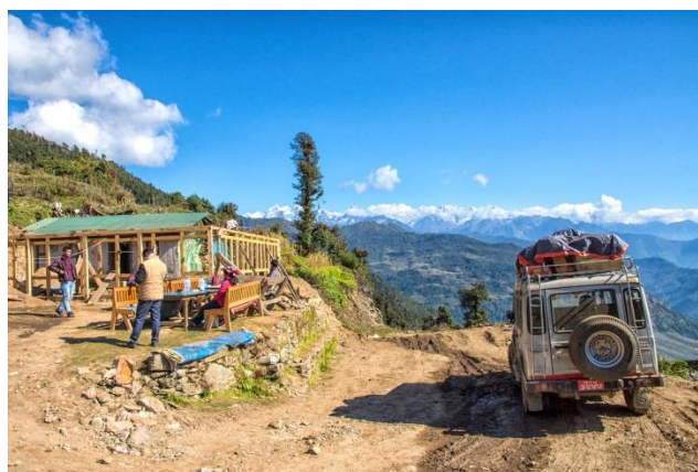
Descente vers Rapcha par la nouvelle piste

Le village a connu d'autres évolutions importantes dans le domaine de l'éducation et de la santé avec l'apport de notre association qui a participé à la construction d'écoles et à la mise en place d'un dispensaire .