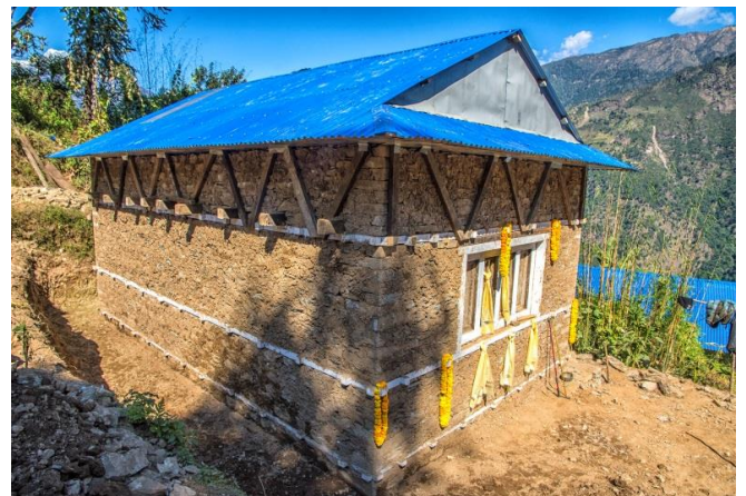
Troisième maison parasismique reconstruite (novembre 2017)

Tout en favorisant la reconstruction, ANUVAM poursuit son action de prévention en matière de santé en finançant à hauteur de 60 euros pour les familles volontaires la construction d'un foyer de cuisine extérieur pour éviter les problèmes pulmonaires très nocifs.