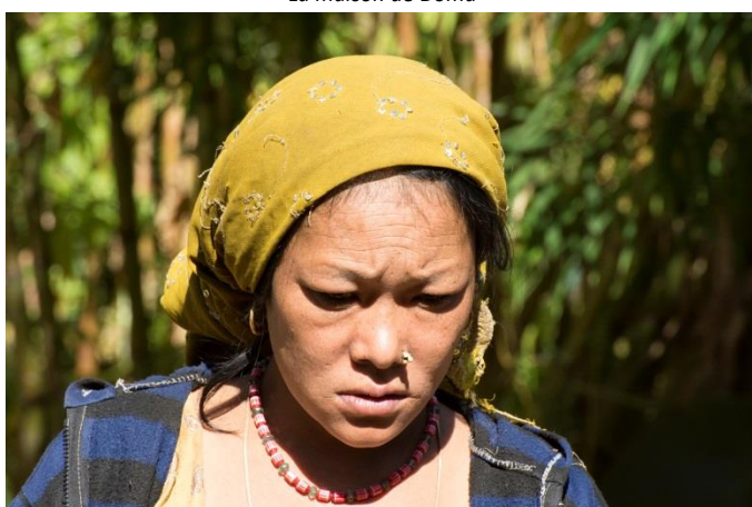
Doma nous expose sa situation avec dignité...