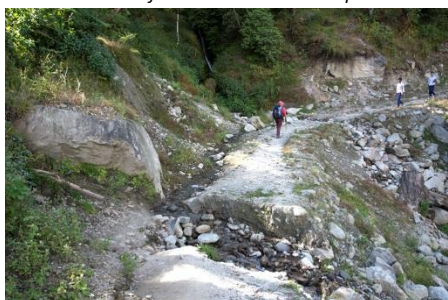
La piste vers Yagachwai est en mauvais état