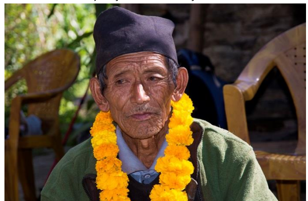
et son mari