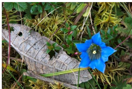
Il y a de belles gentianes