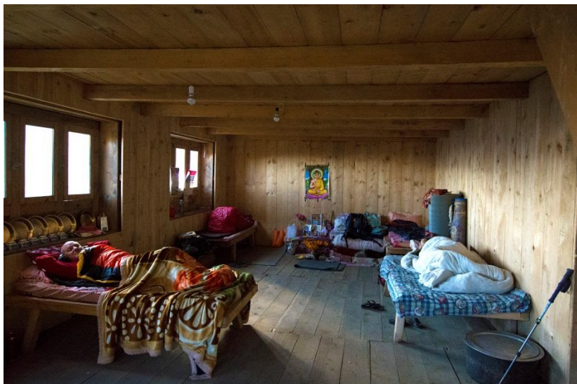
Sieste au lodge de Gumne sous le regard bienveillant de Bouddha