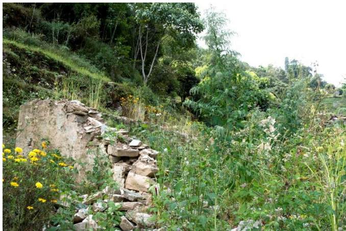
Ce qu'il reste de la maison de Maiti