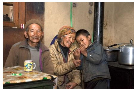
Les propriétaires du lodge de Gumne