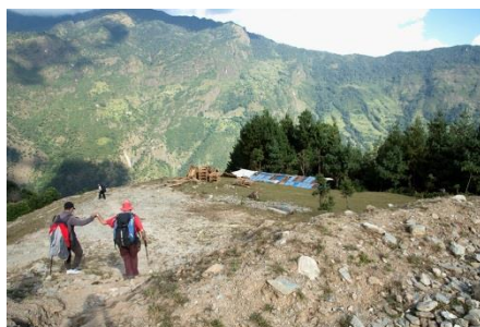
Arrivée au-dessus de l'école de Basakhali