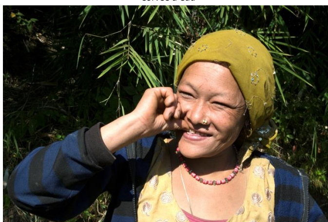
... sans perdre le sourire