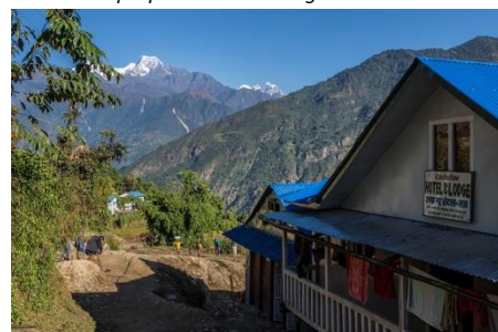
Le lodge de Kumar