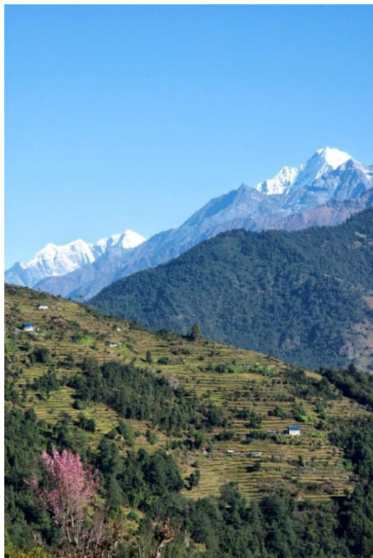
En route vers Gumne

Sous un soleil toujours radieux nous quittons Rapcha pour rejoindre Phaplu après avoir de nouveau fait étape à Gumne.