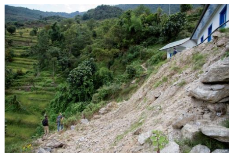
Classrooms in the clouds soon in the gully!!