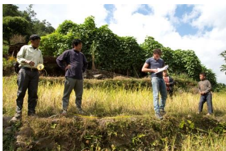
Mesure du terrain