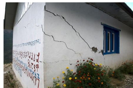
No comment !