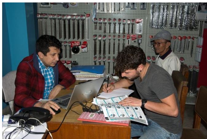
Choix d'une scie électrique