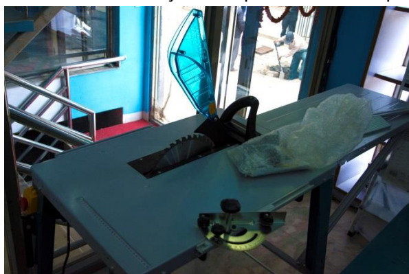
Scie électrique sur table et groupe électrogène