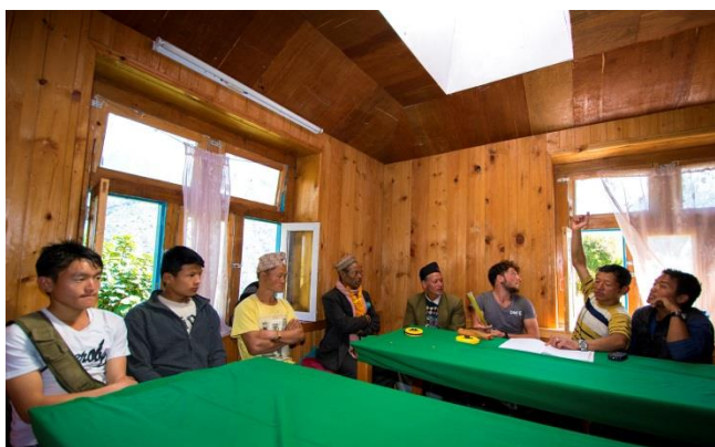
Quelques-uns des reconstruteurs volontaires