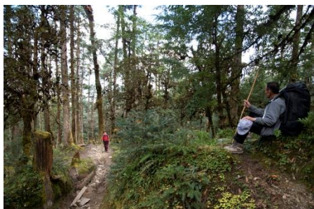
Dans la forêt au-dessus de Phaplu