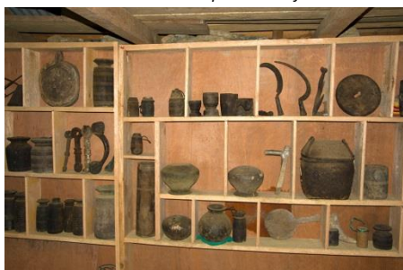
Une partie du musée