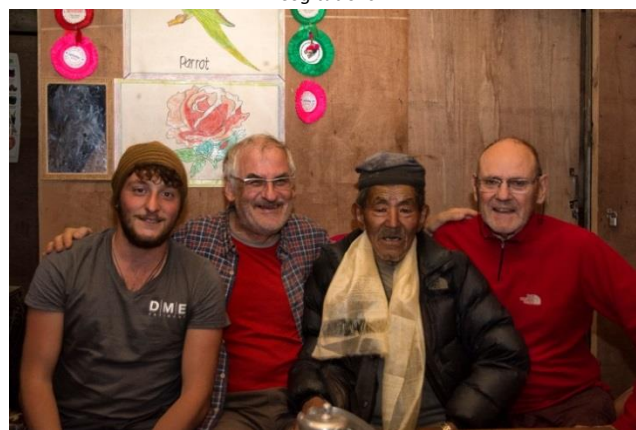
Kabare et notre trio