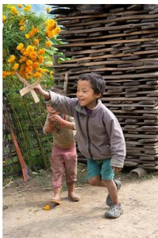
Les enfants jouent