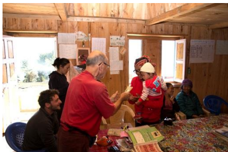
Remise de 6000 roupies à une famille