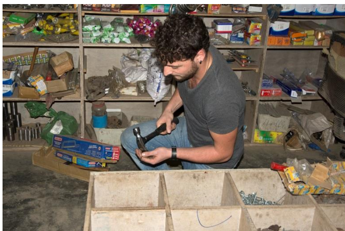
Essai de marteau

La journée est consacrée à la visite de magasins, principalement deux, un magasin de matériel de base (clous, vis, pinces, marteaux, burins, pelles, pioches, etc.), un magasin de matériel spécialisé (groupe électrogène, scie, rabot électriques, etc.).