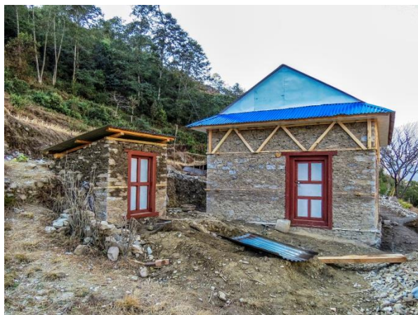
Maison et toilettes parasismiques construites en janvier 2019

ANUVAM poursuit également son action de prévention en matière de santé en finançant à hauteur de 60 € pour les familles volontaires la construction d'un foyer de cuisine extérieur pour éviter les problèmes pulmonaires.