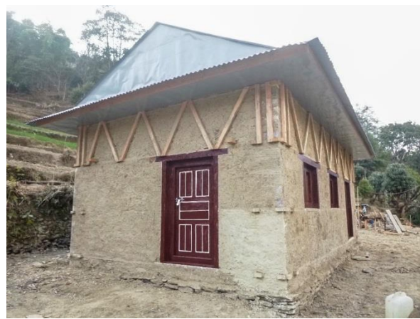
Maison parasismique construite en décembre 2020

Durant les hivers 2018-19, 2019-20 et 2020-21 huit autres maisons ont été construites, avec l'aide des maîtres d'œuvre népalais, pour des familles qui jusque-là vivaient dans des cabanes. ANUVAM a fourni une aide financière de 6000 € par maison en partenariat avec l'association CDC développement solidaire 2 qui a apporté une contribution aux dernières constructions.